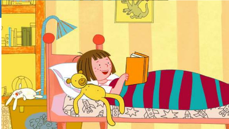
Przytul mnie. Poszukiwacze miodu