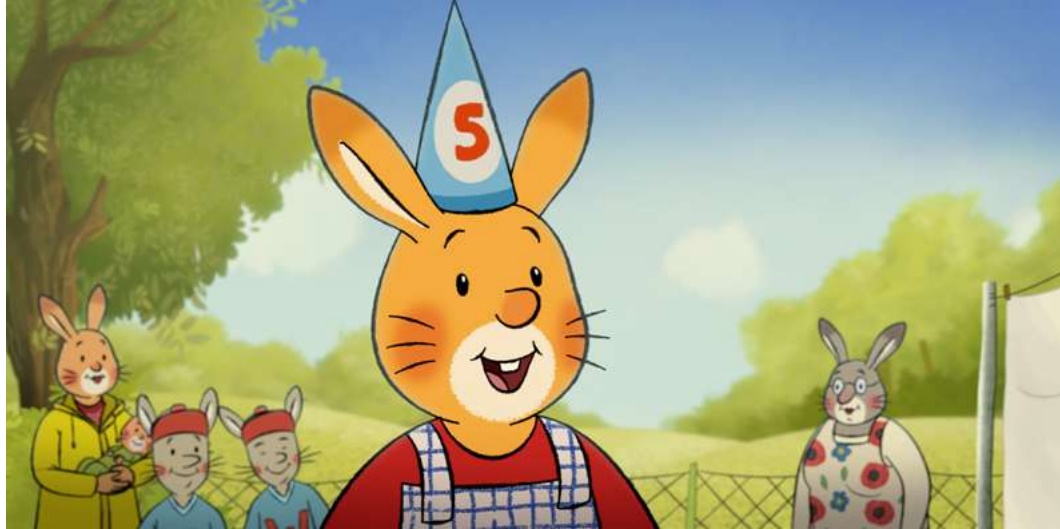
Najlepsze urodziny Królika Karola