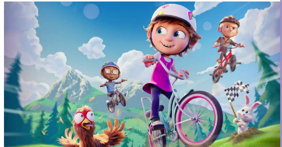
Ella Bella Bingo