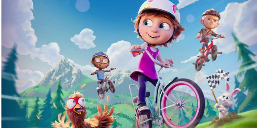
Ella Bella Bingo