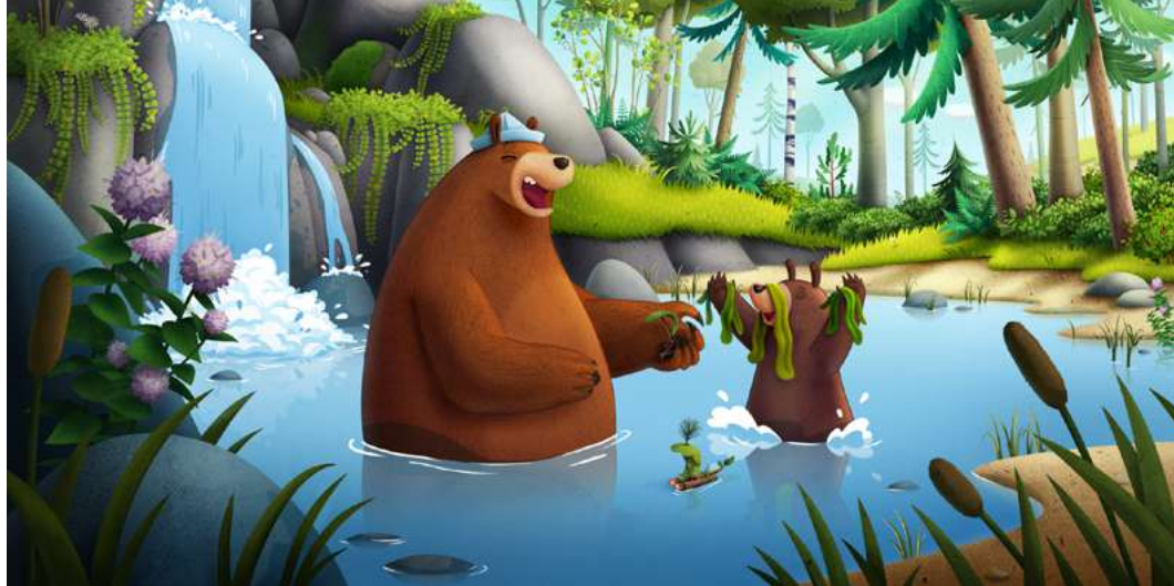
Przytul mnie. Poszukiwacze miodu