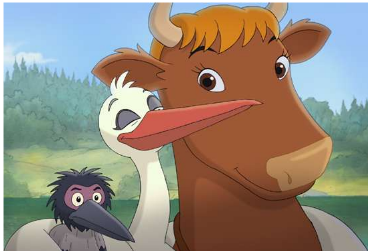
Mama Mu wraca do domu