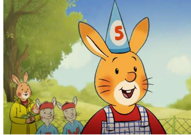
Najlepsze urodziny Królika Karola